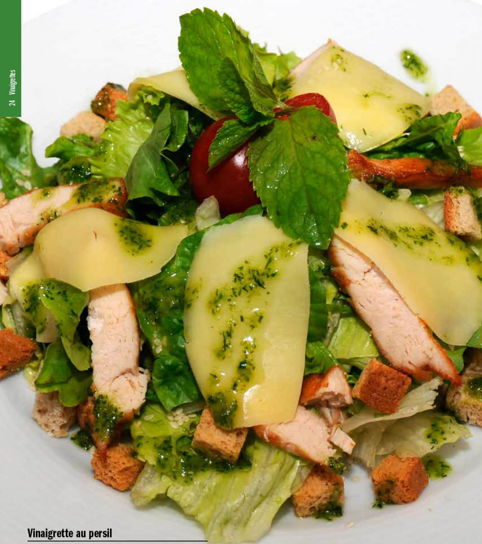
Vinaigrette au persil