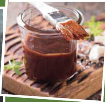
MARINADE AU KETCHUP