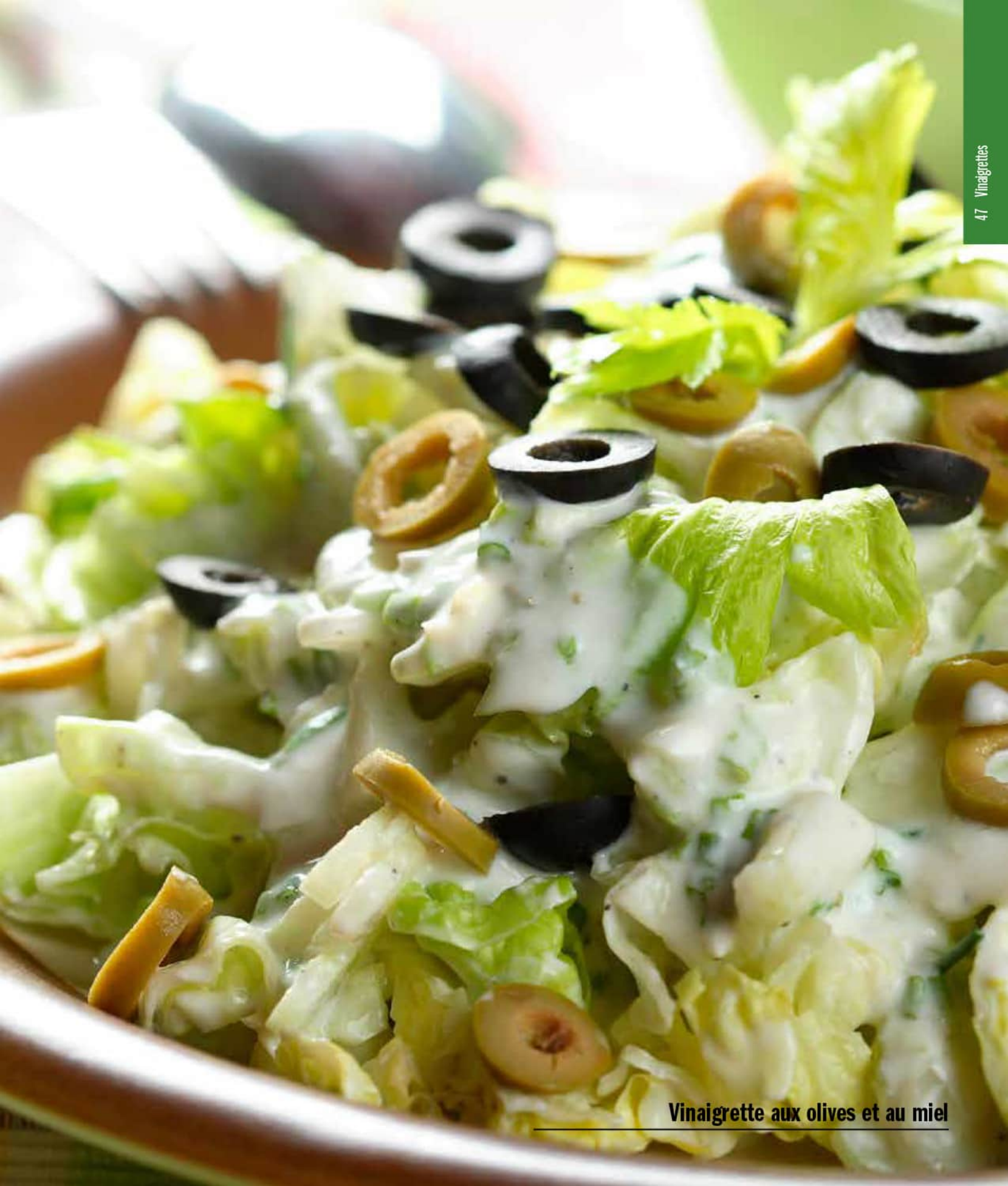
Vinaigrette aux olives et au miel