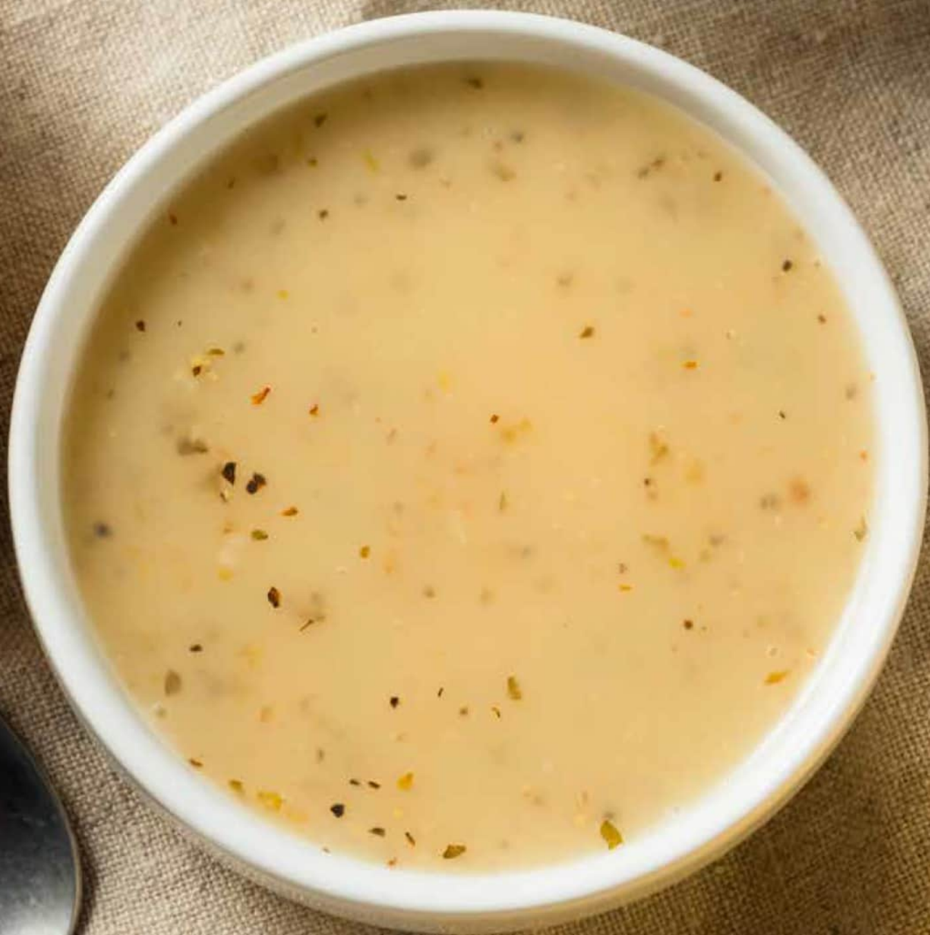
Vinaigrette aux fines herbes