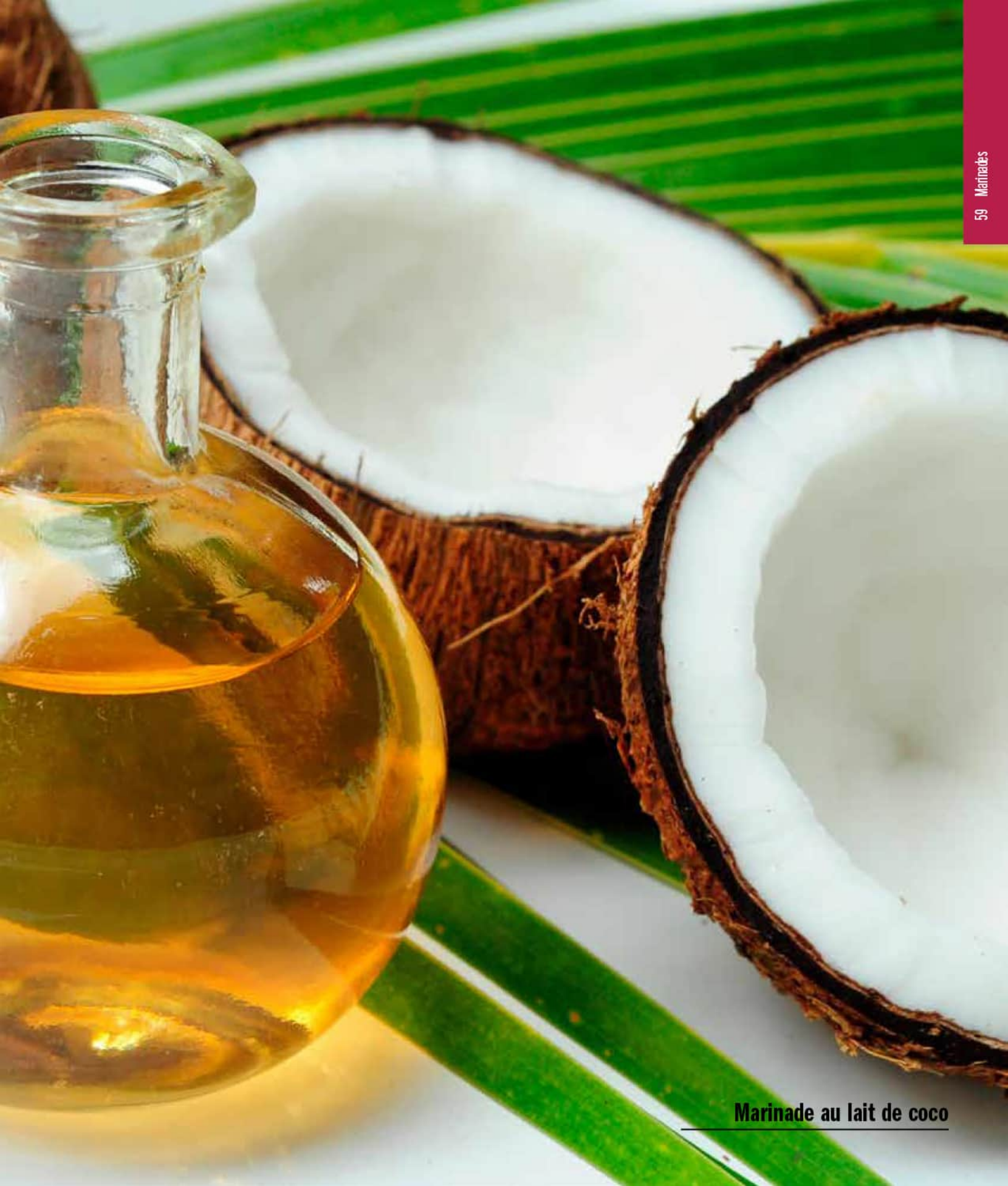
Marinade au lait de coco