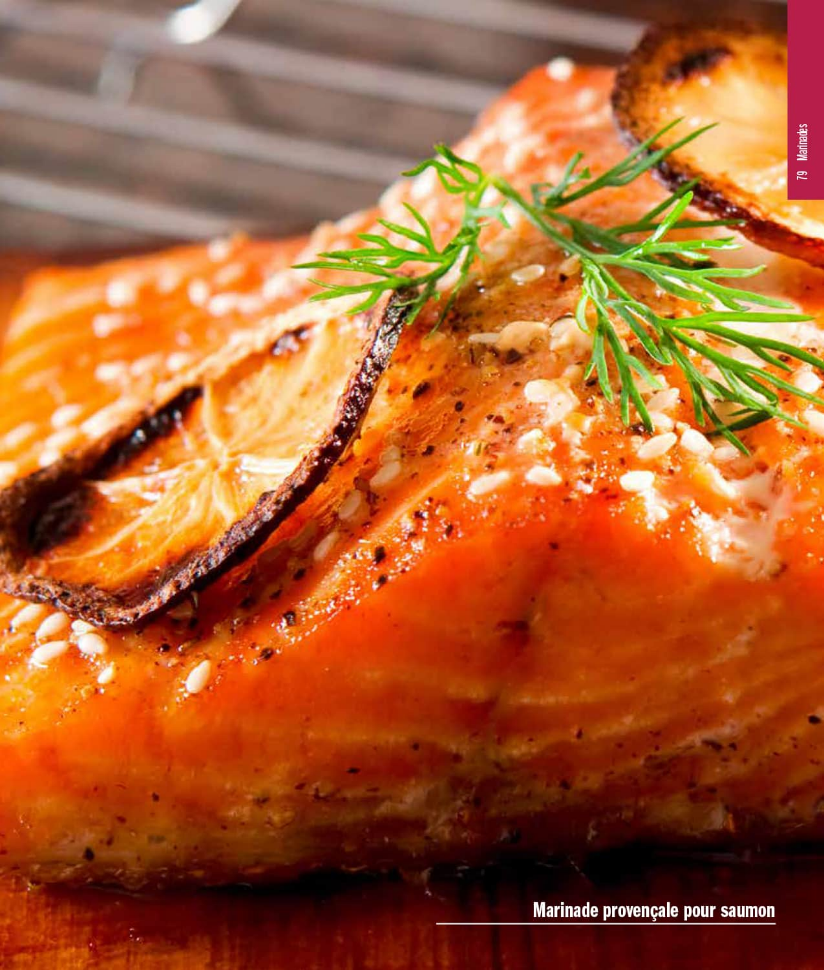
Marinade provençale pour saumon