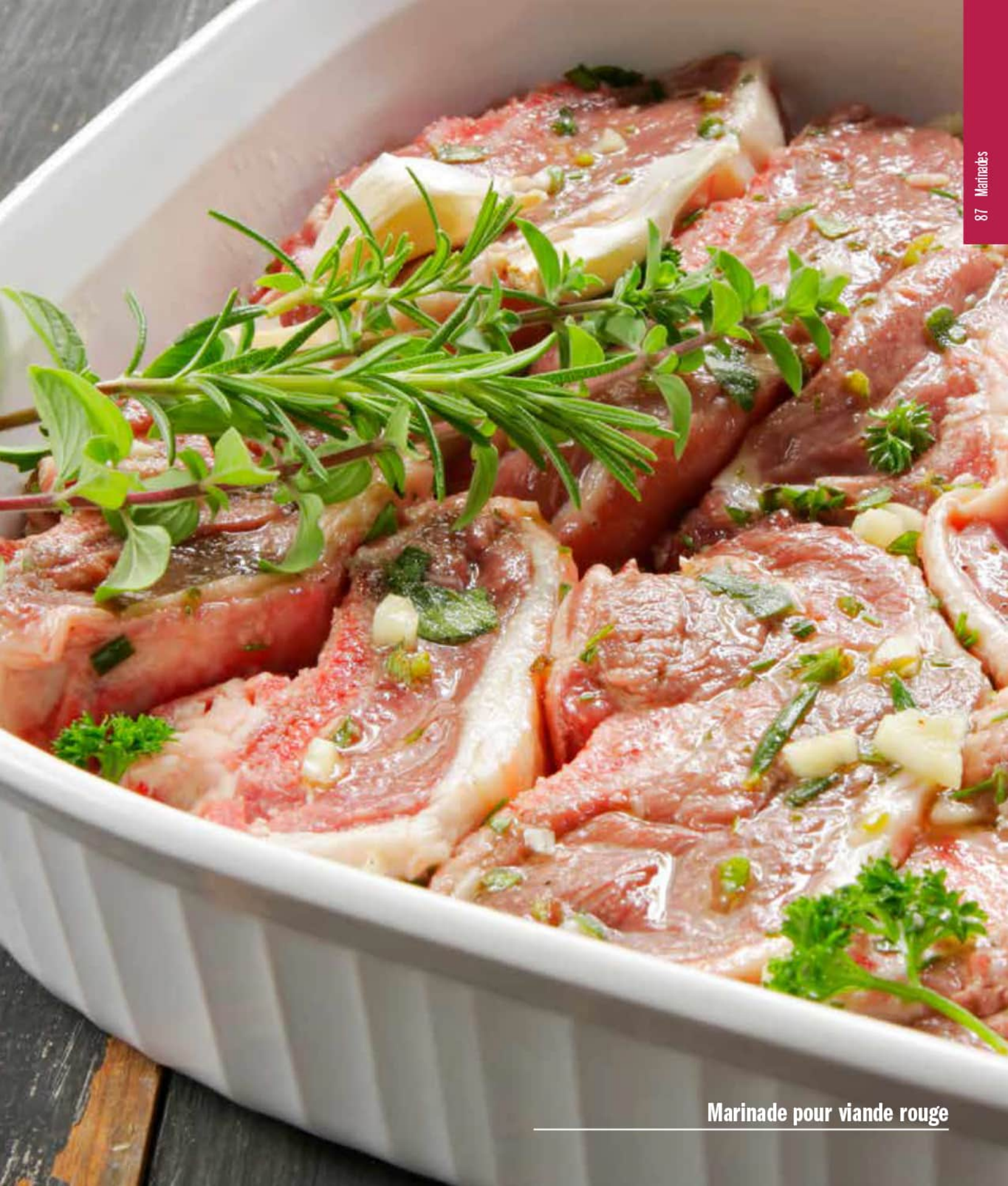
Marinade pour viande rouge