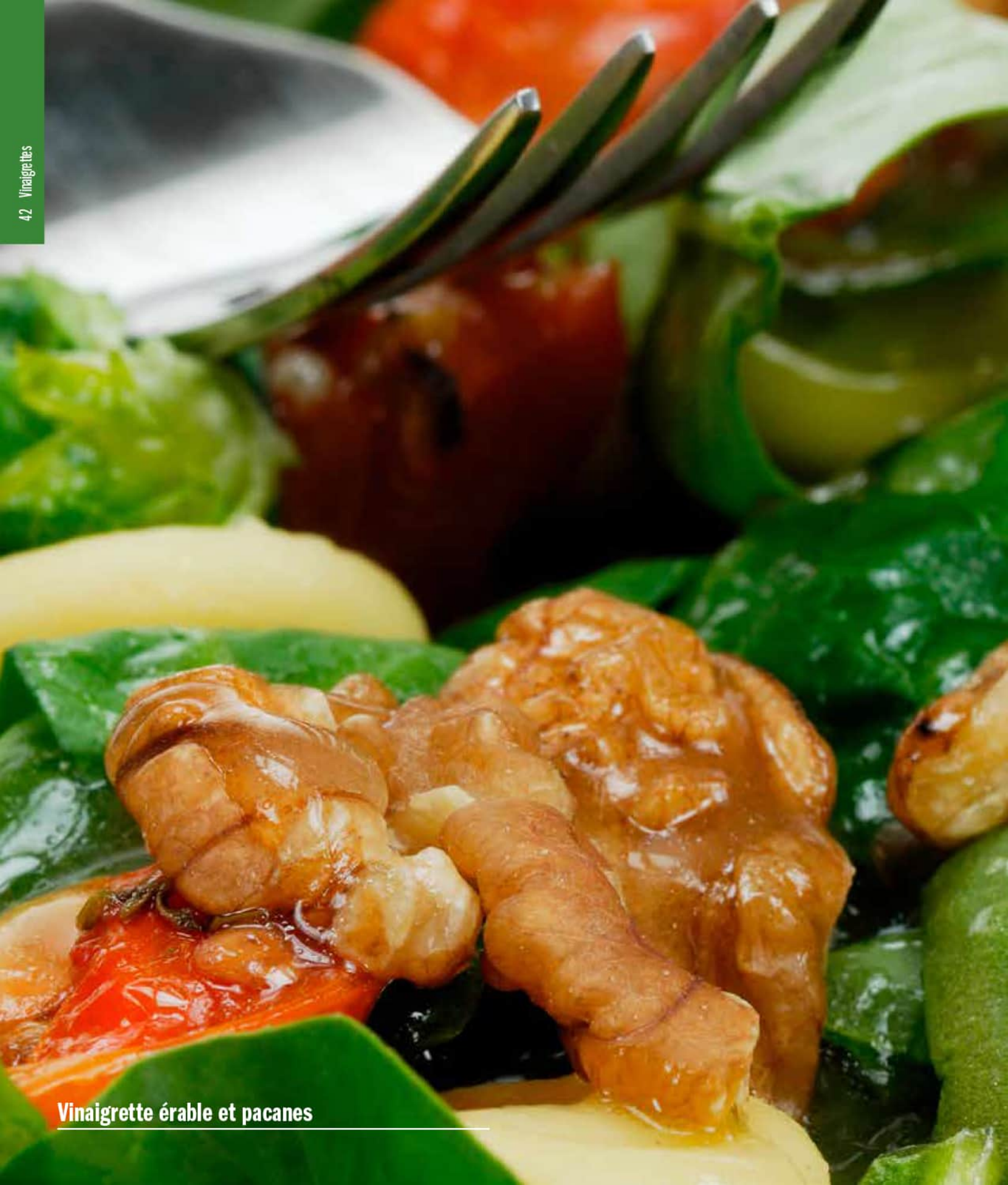
Vinaigrette érable et pacanes