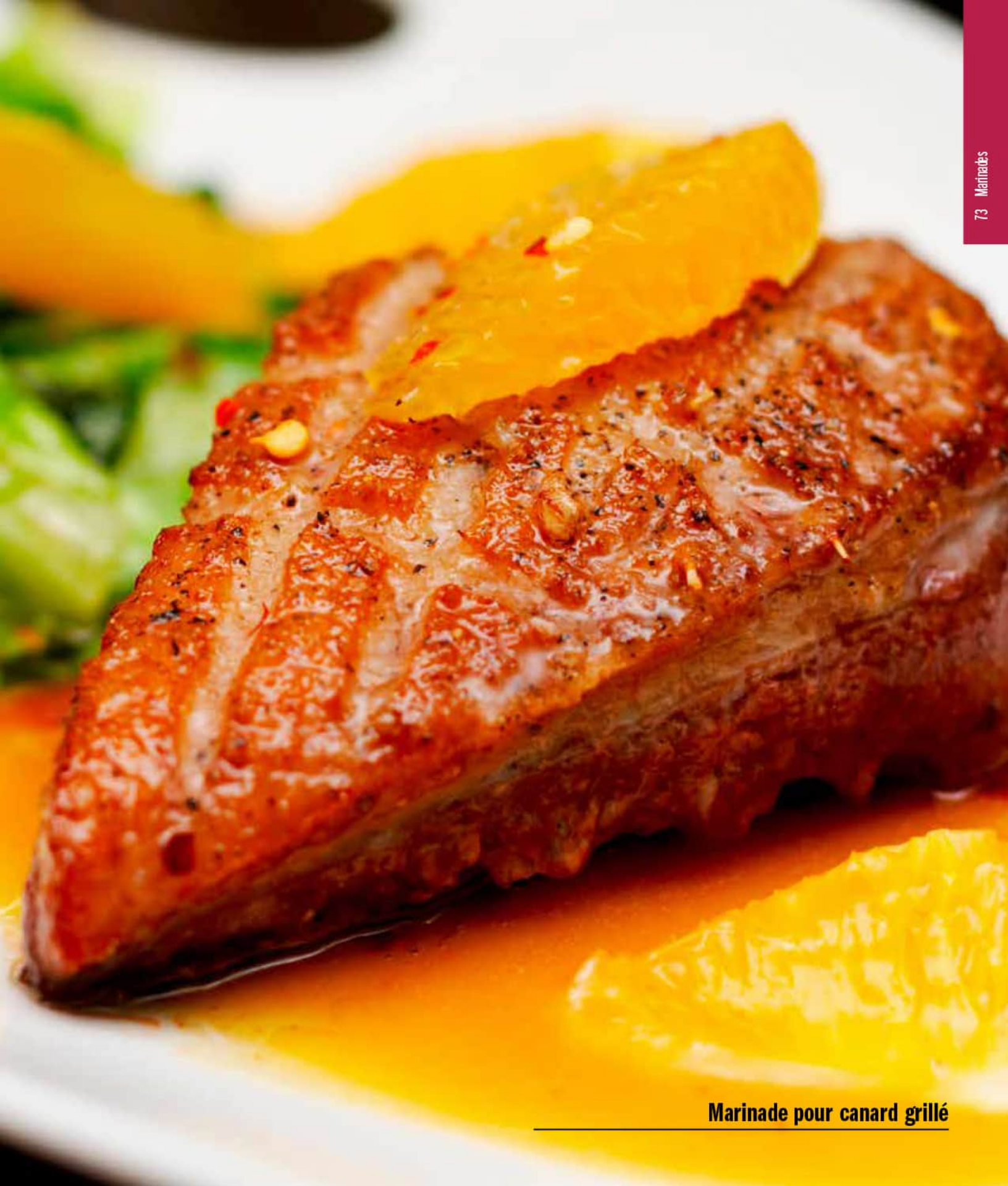
Marinade pour canard grillé