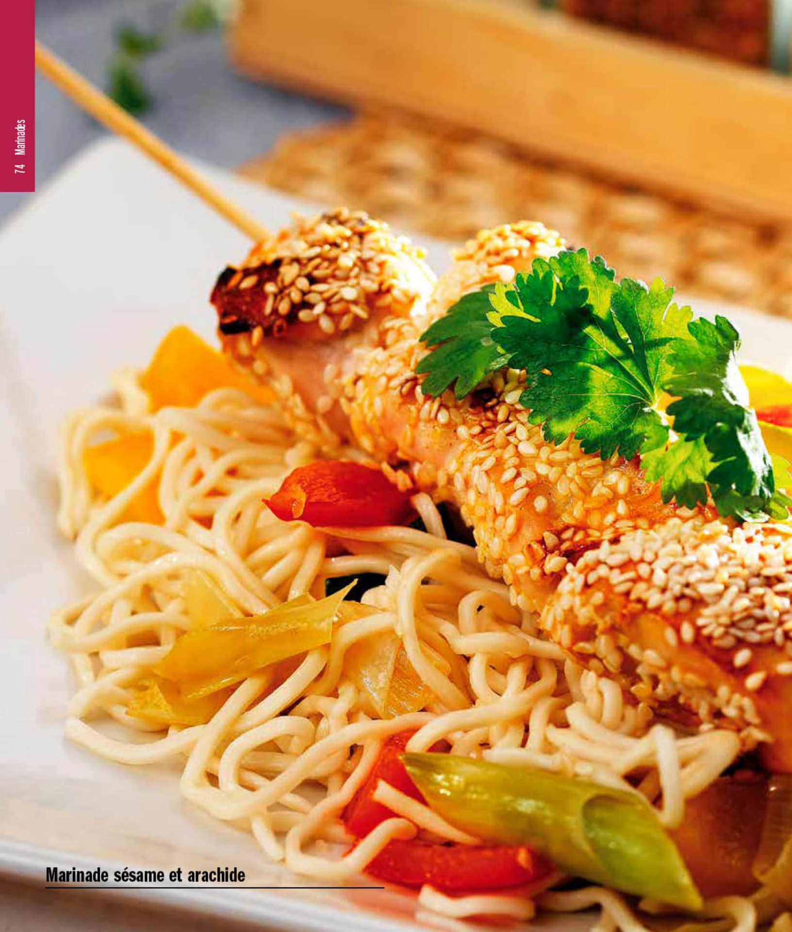
Marinade sésame et arachide