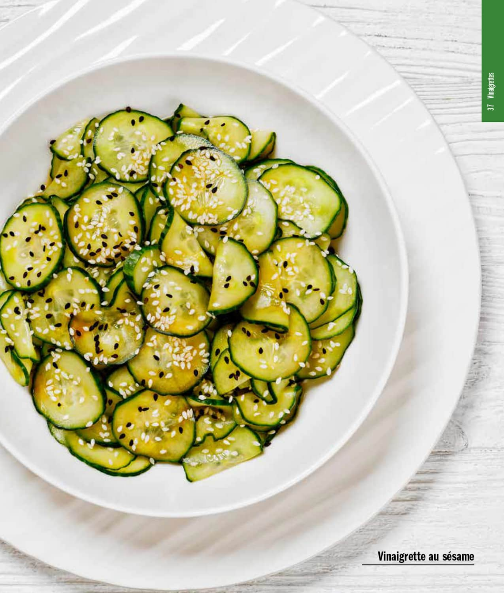
Vinaigrette au sésame