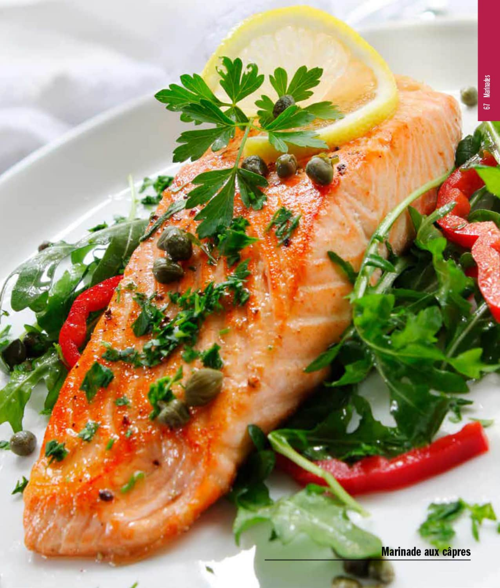
Marinade aux câpres