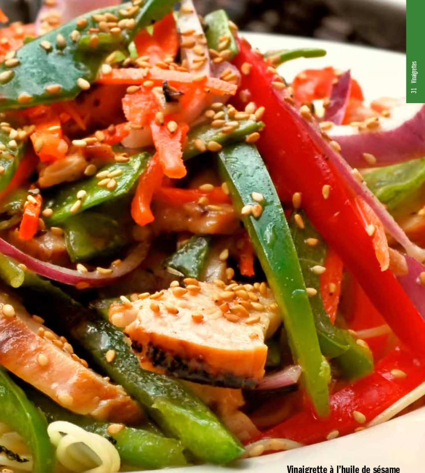
Vinaigrette à l'huile de sésame