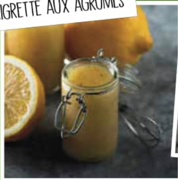
VINAIGRETTE AUX AGRUMES