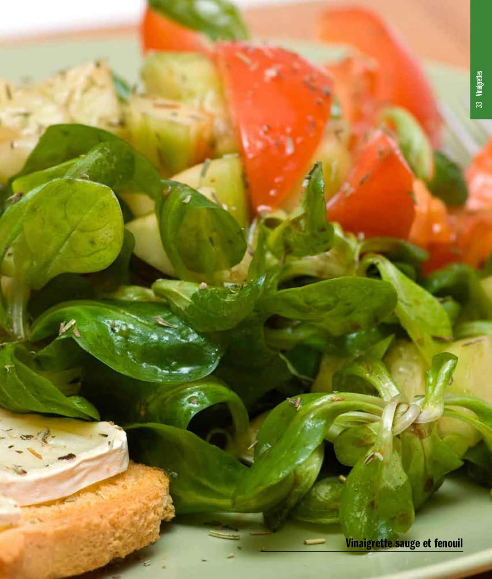
Vinaigrette sauge et fenouil