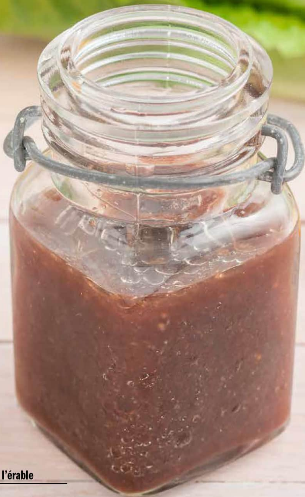
Vinaigrette balsamique à l'érable