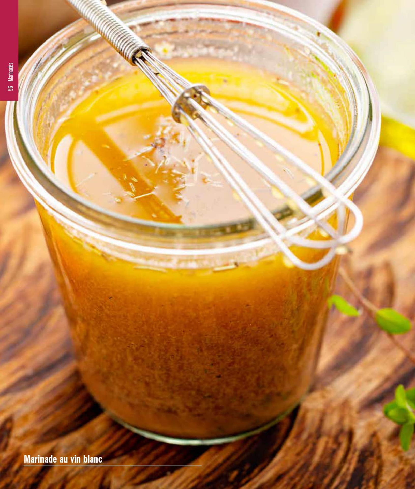
Marinade au vin blanc