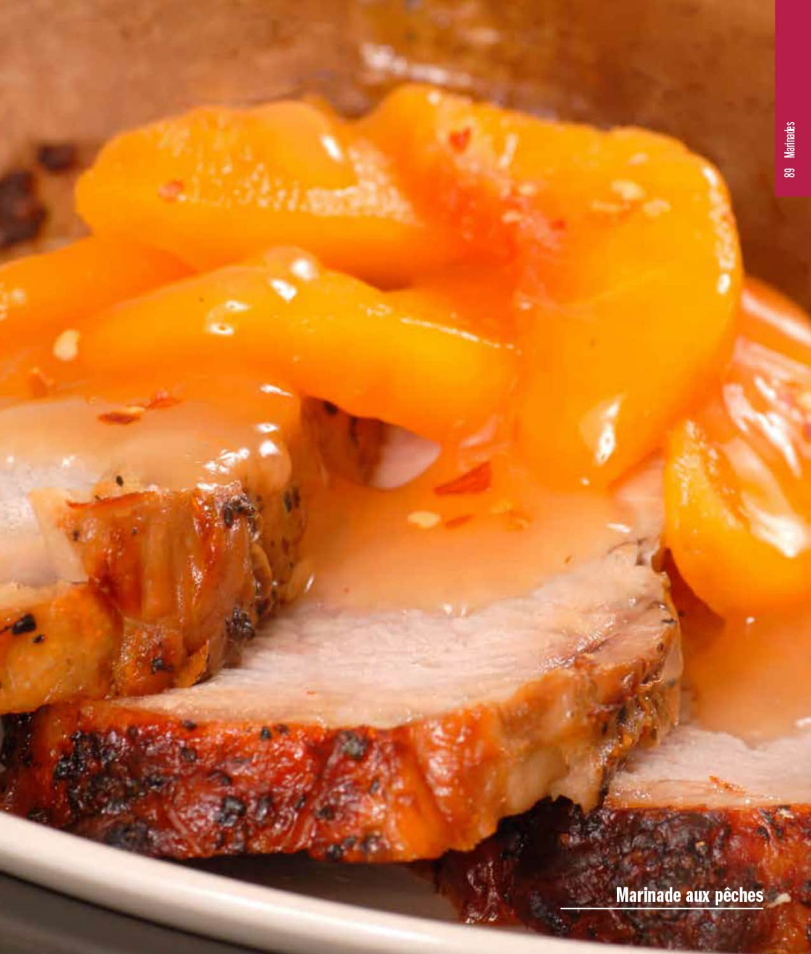
Marinade aux pêches