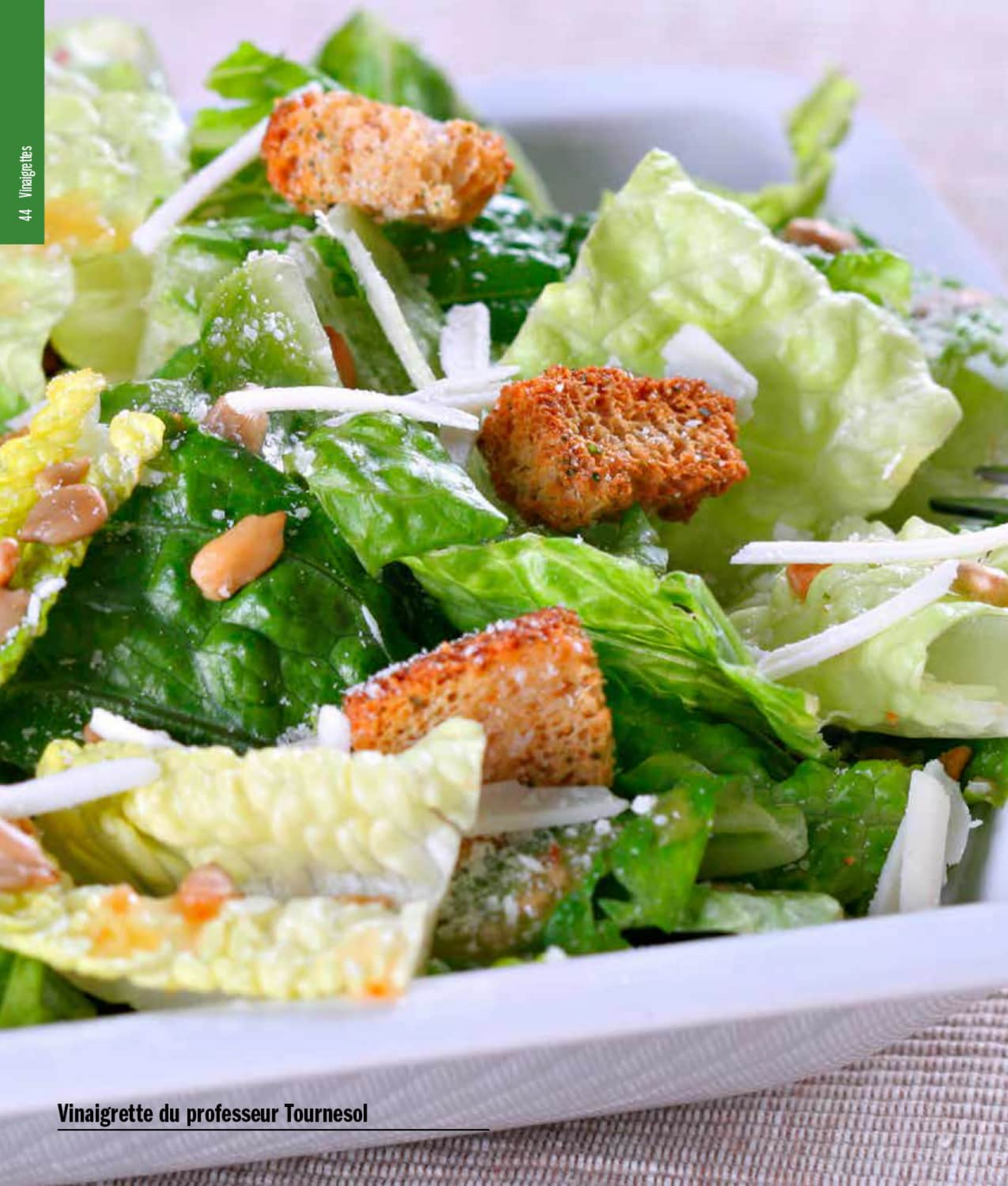
Vinaigrette du professeur Tournesol