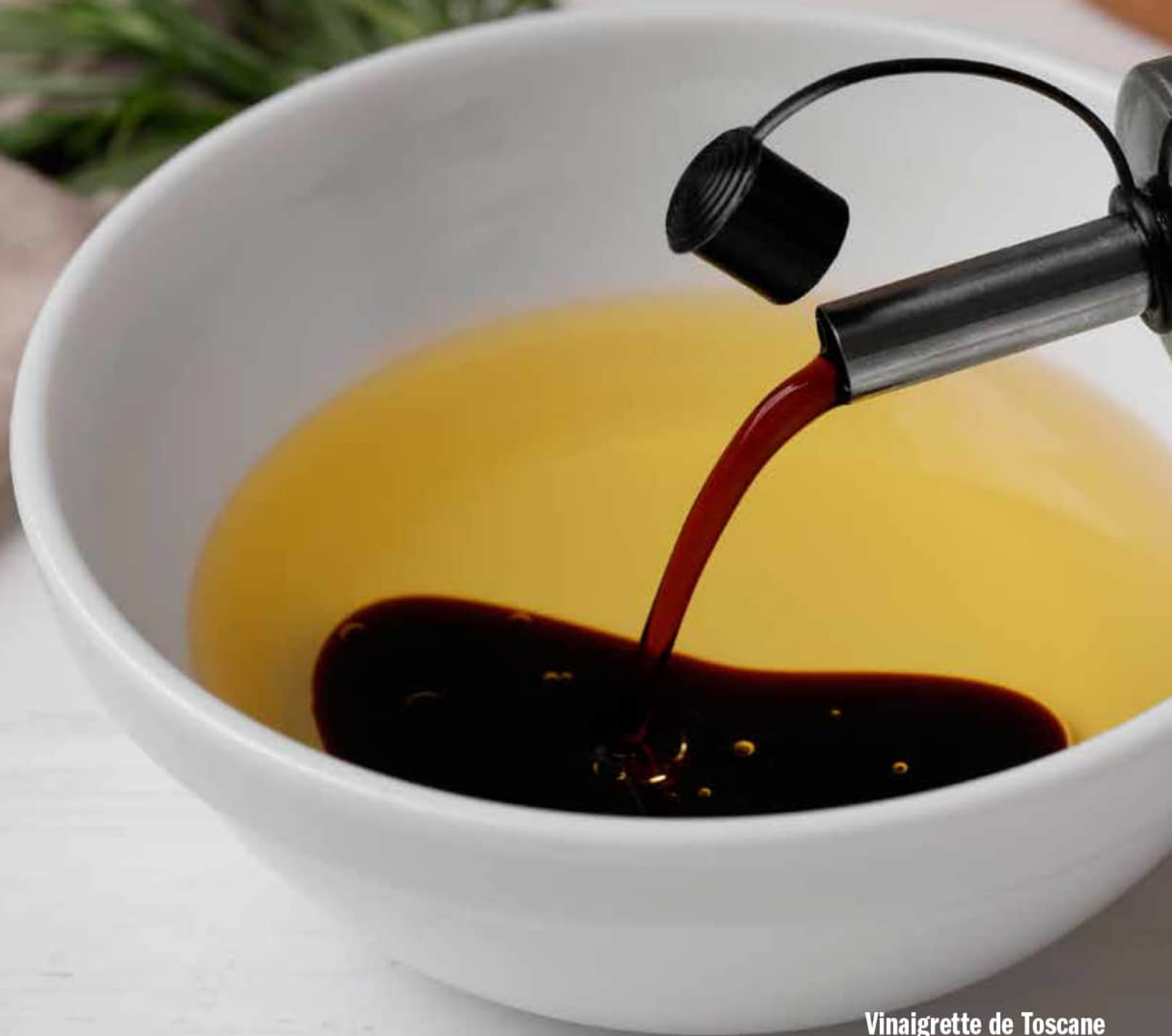
Vinaigrette de Toscane