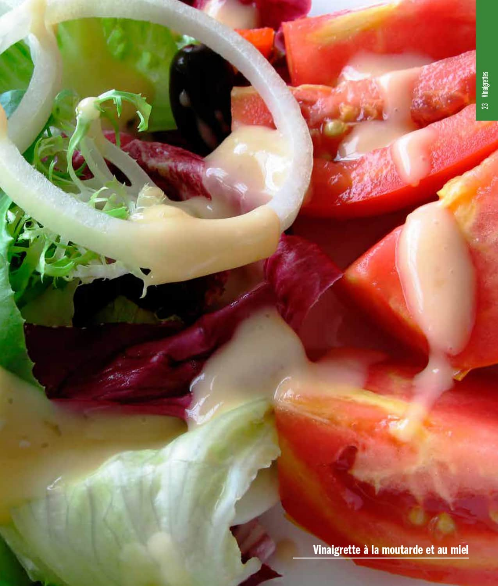
Vinaigrette à la moutarde et au miel