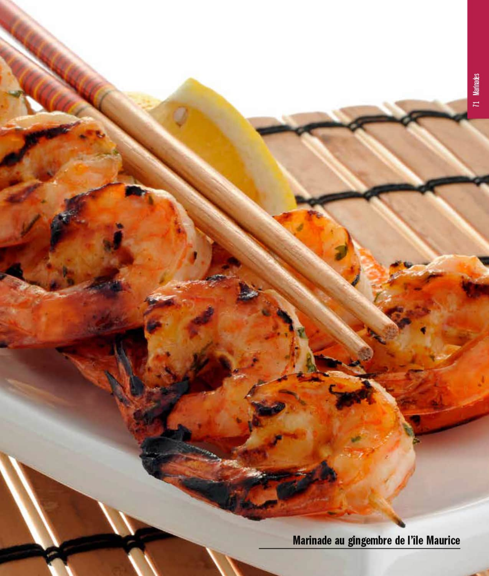
Marinade au gingembre de l'île Maurice