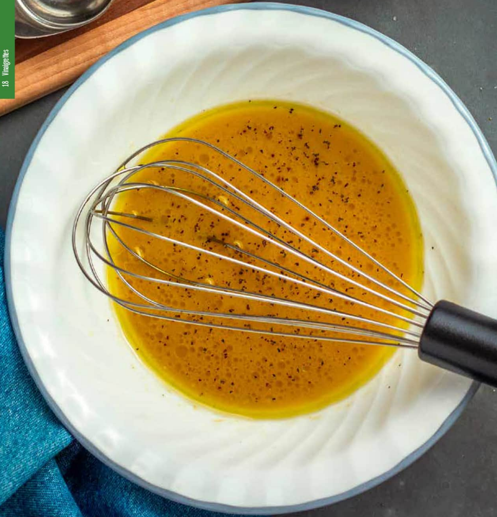
Vinaigrette au poivre rouge