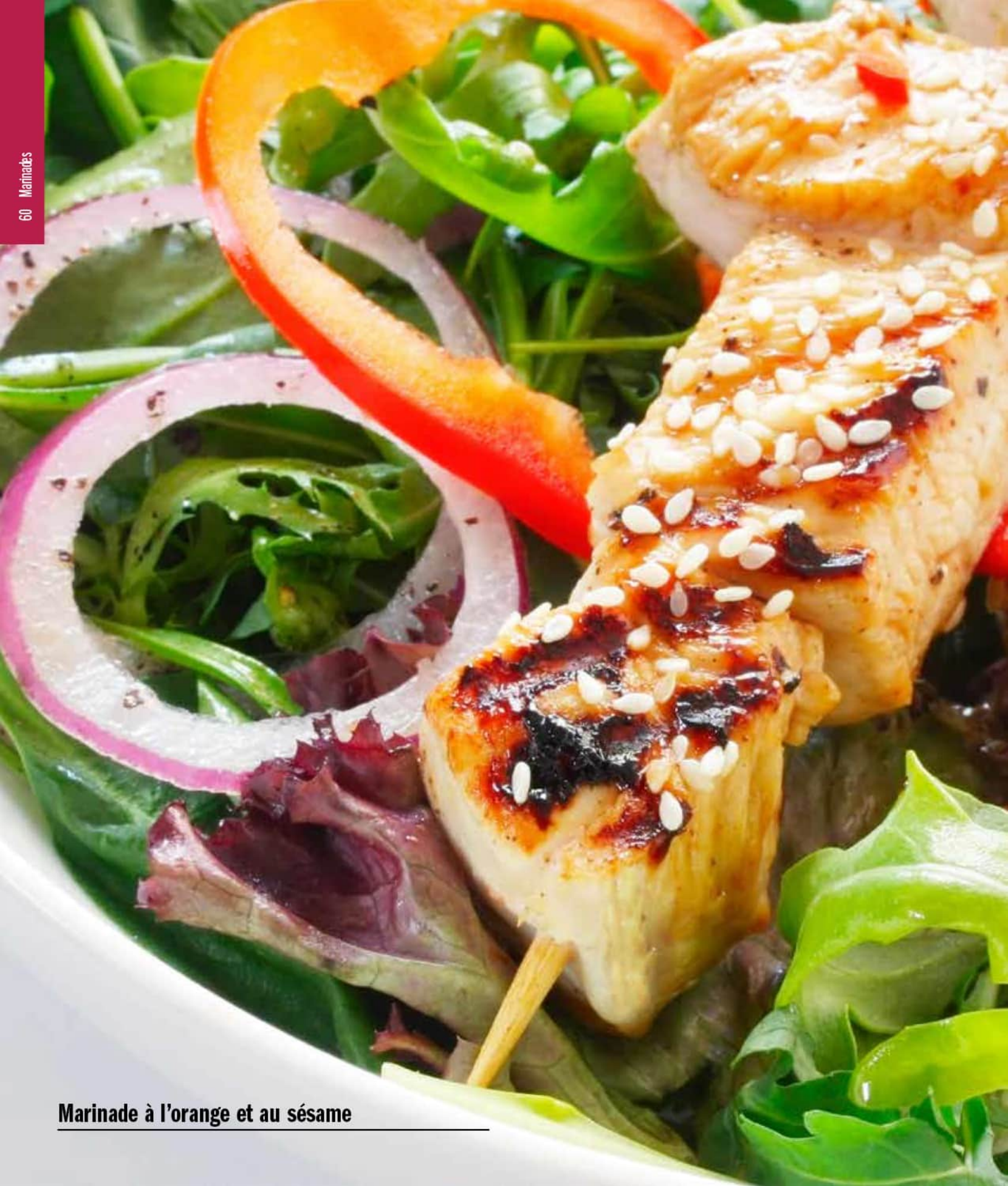
Marinade à l'orange et au sésame