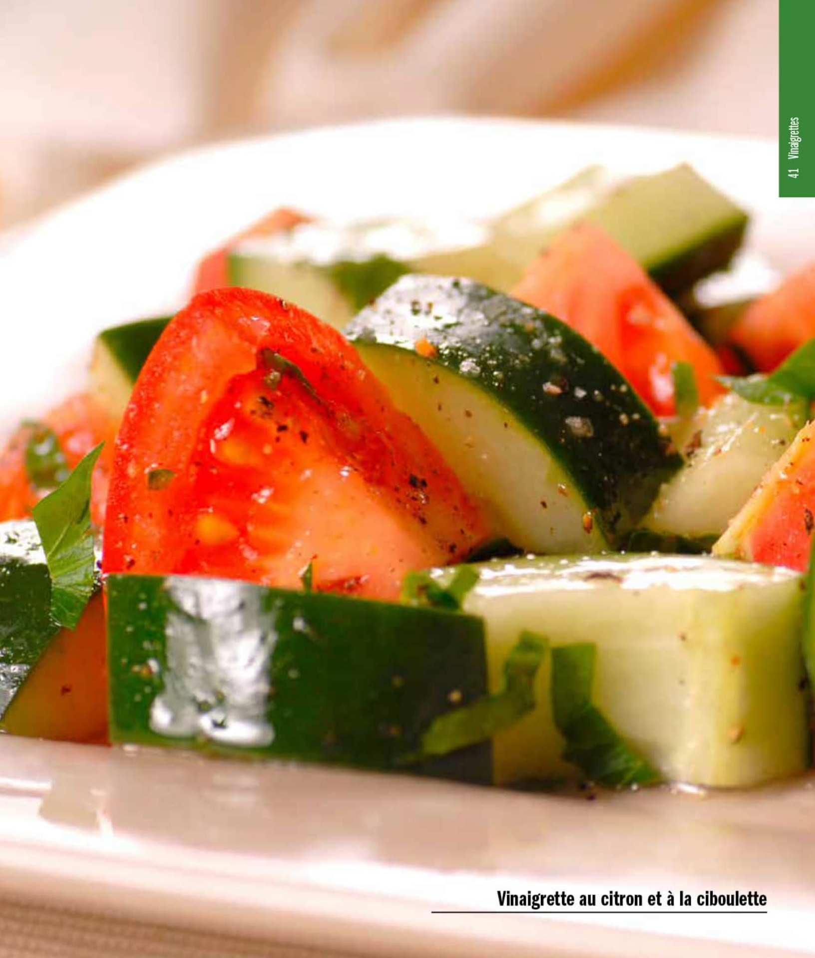
Vinaigrette au citron et à la ciboulette