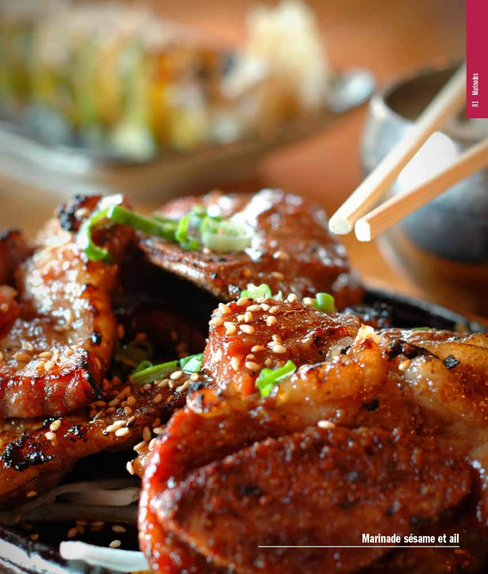
Marinade sésame et ail