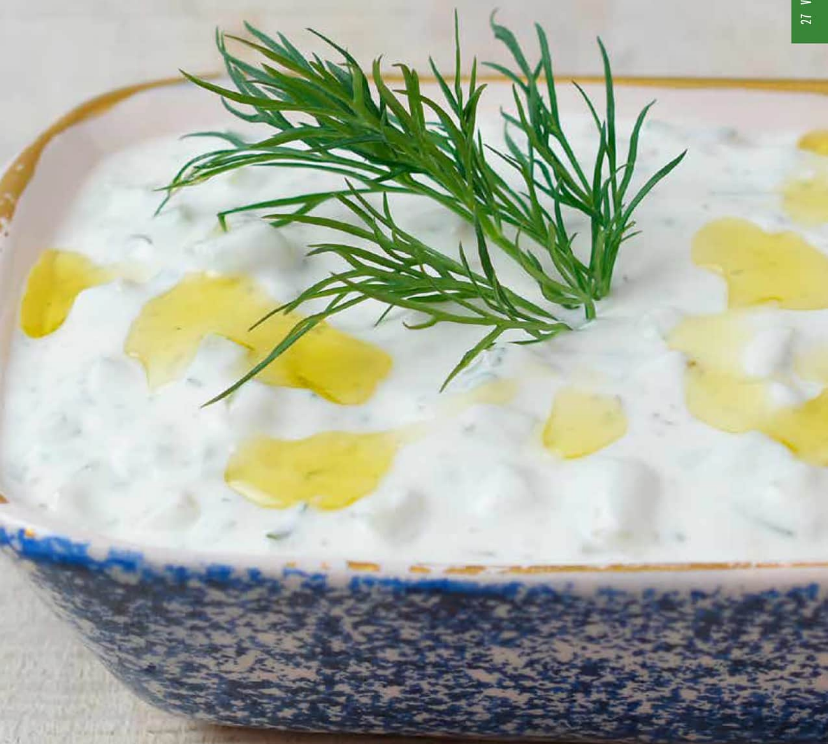
Vinaigrette estivale à l'aneth et au yogourt