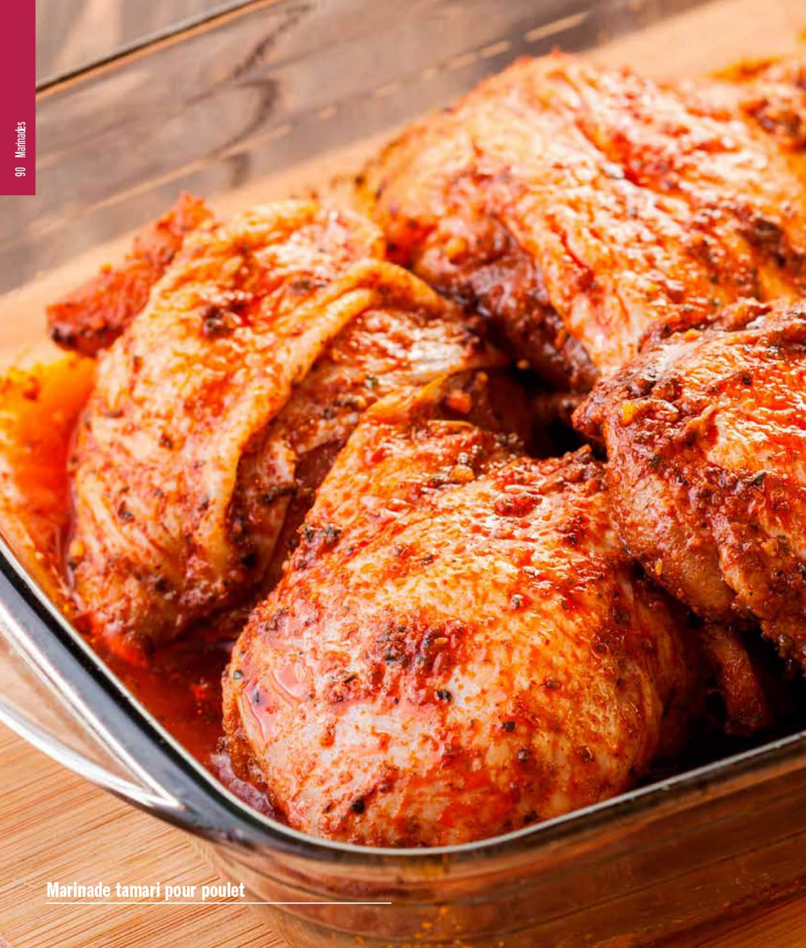
Marinade tamari pour poulet