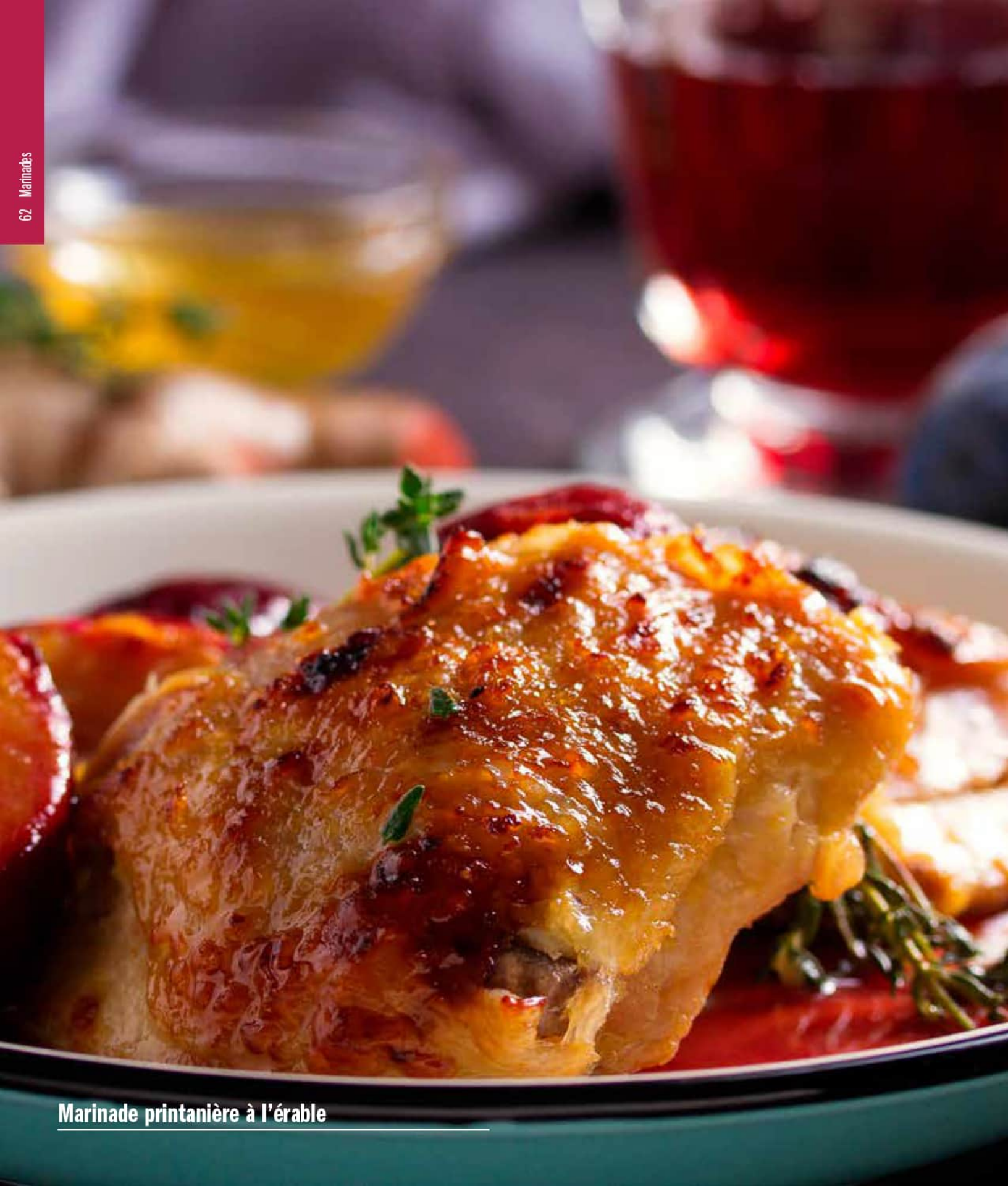
Marinade printanière à l'érable