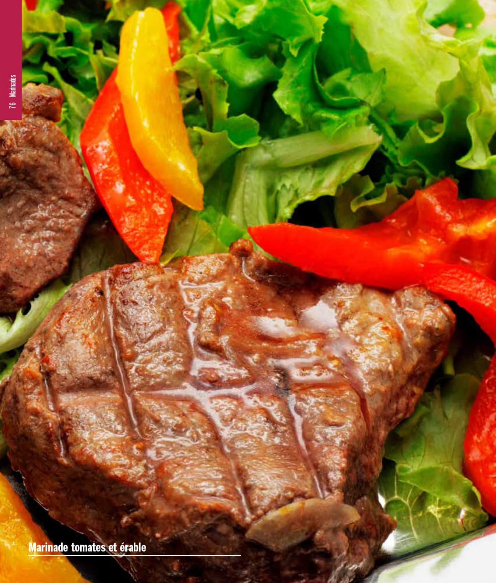
Marinade tomates et érable