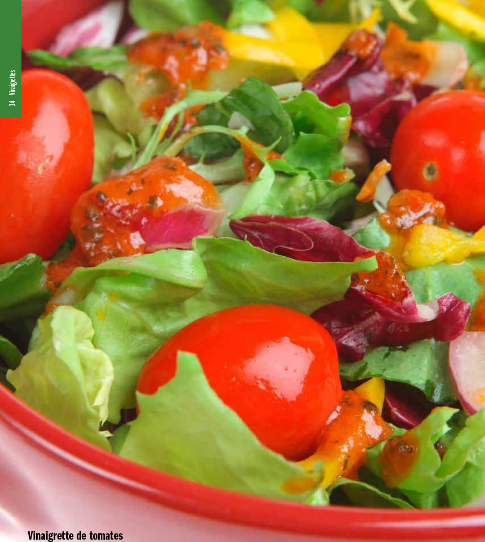
Vinaigrette de tomates