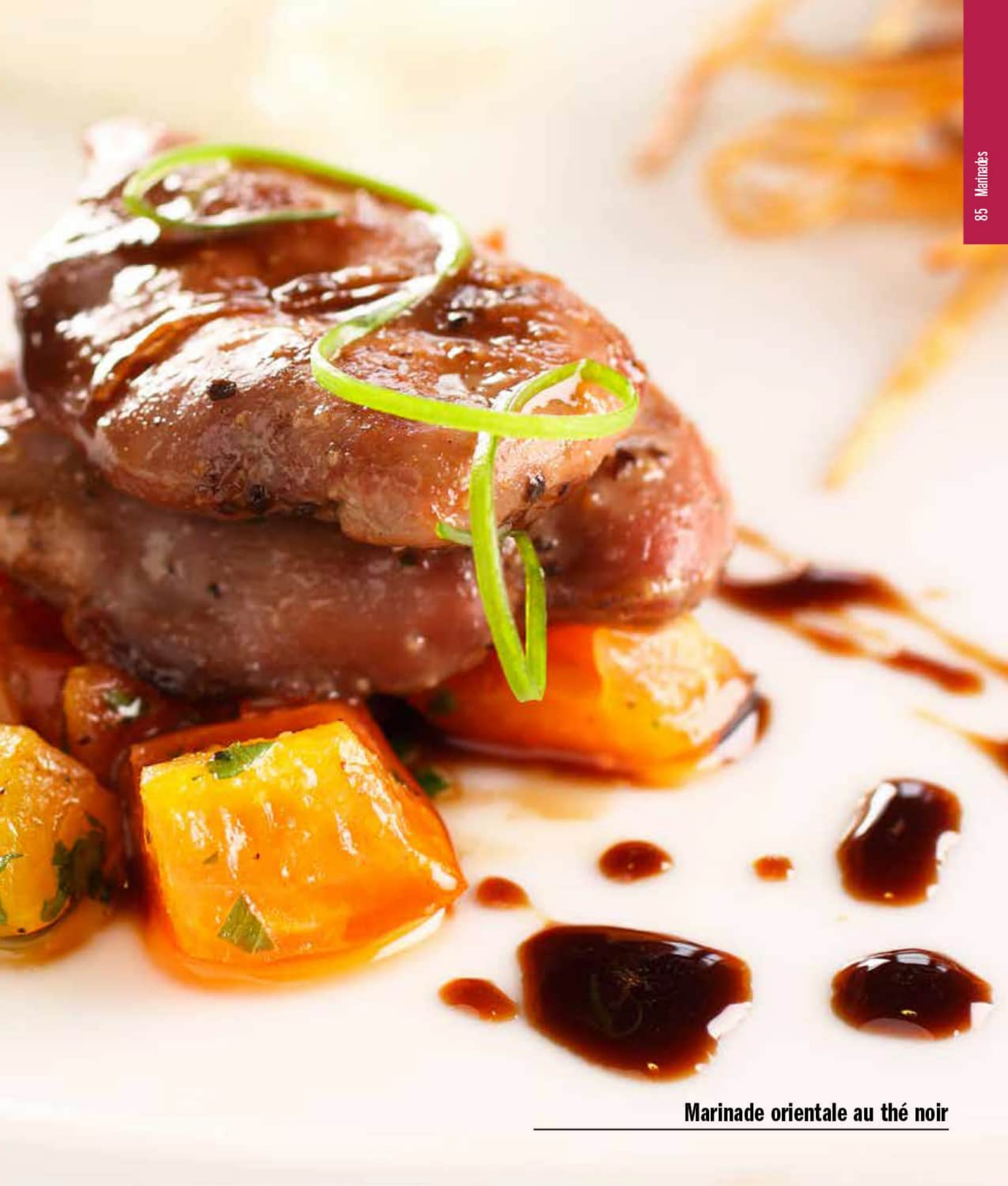
Marinade orientale au thé noir