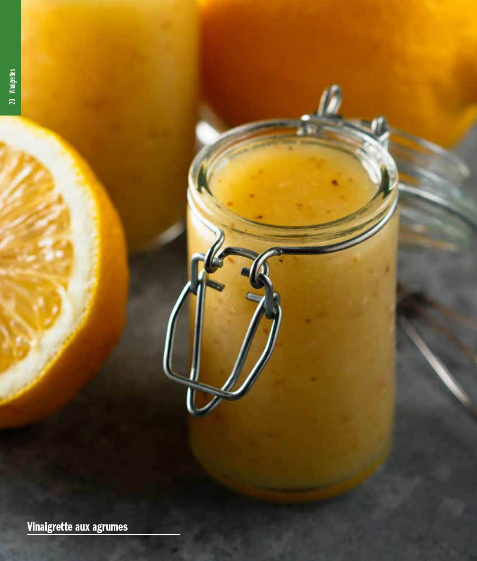
Vinaigrette aux agrumes